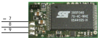
Fig. 3: Anschluss eines Hallensors